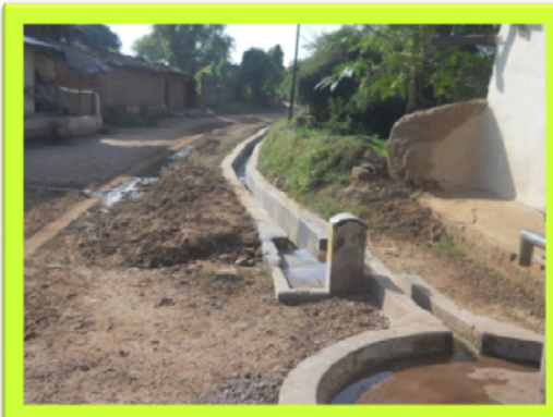
राठिया मोहल्ला, टण्डी