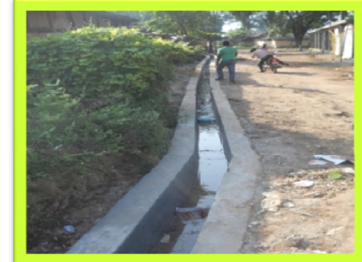
सिदार मोहल्ला, टण्डी