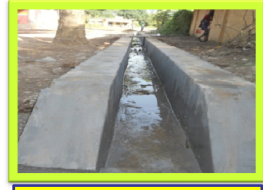
बाजार चौक, बीच बस्ती टण्डी