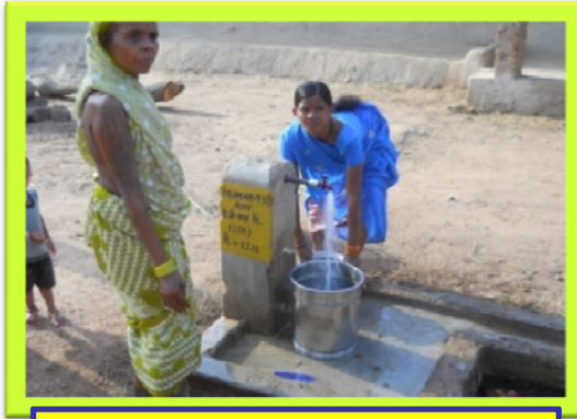
बीच बस्ती टण्डी

स्वच्छता के अन्य आयामों पर डी.बी. पावर लिमिटेड के प्रयास..