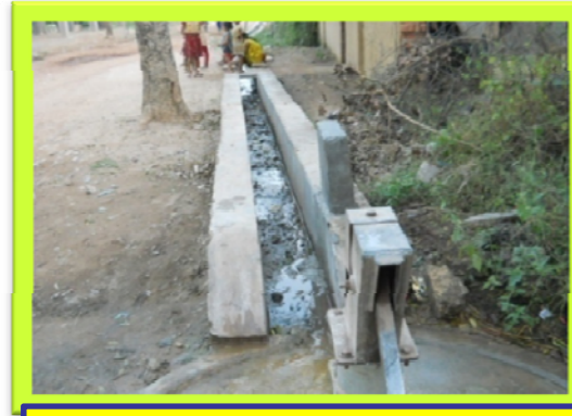
बाजार चौक, बीच बस्ती टण्डी