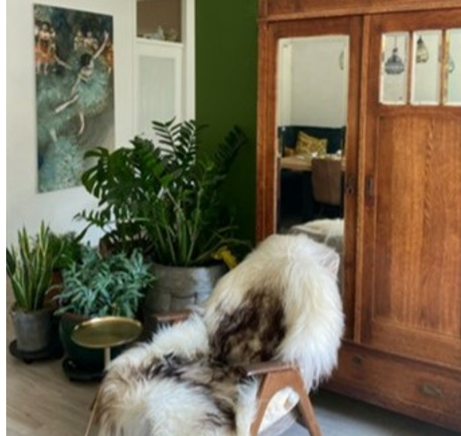
De gezellige woonkamer van het Jongerenhuis .