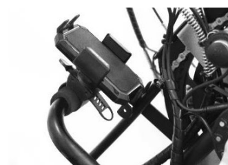
Support pour téléphone portable