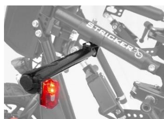
Barre de feux arrière rabattable