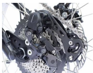
Engrenages électriques Shimano XT 11 vitesses