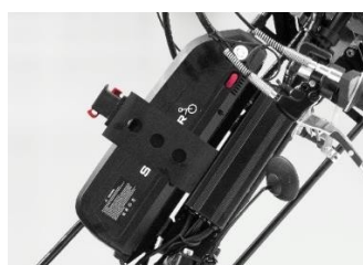
Support KLIICKfix sur le tube de direction