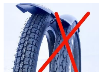
Pneus route 20x2.25