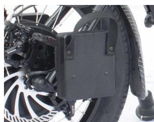
Poids sur la fourche