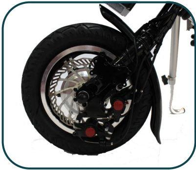
Roue de 12 pouces avec frein à disque double étriers