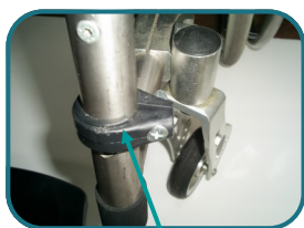
Repère de fixation