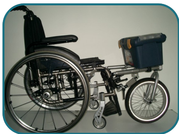
LOMO avec caisse à outils