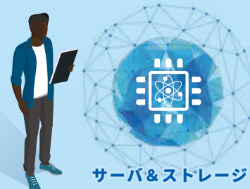
サーバ&ストレージ

エンドポイント、ネットワーク、データベースに至るまで、セキュリティソリューションがお客様のビジネスを全方位で守ります。