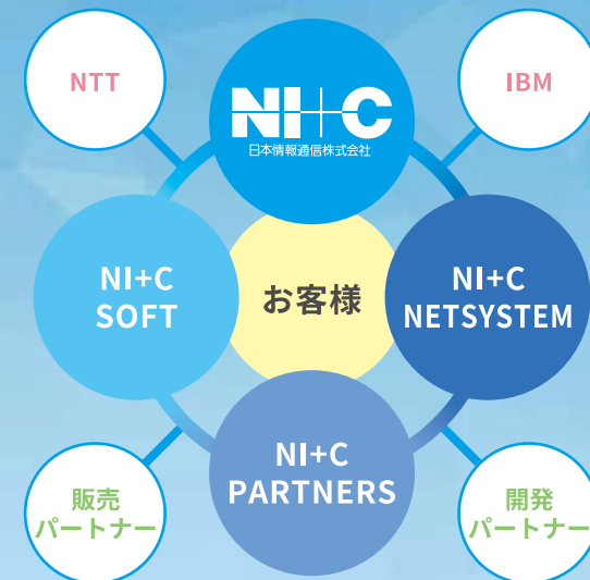
NI+Cの強固なパートナーシップ体制

私たちの提供するソリューションは、NTTのネットワーク技術とIBM製品などを組み合わせ、最新の技術情報と最適な教育を受けた経験豊富なスタッフがお客様にとっての最適解を導き出した、「最新で最良の逸品」になると信じています。