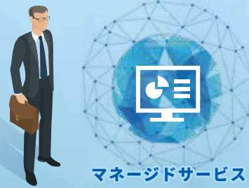
マネージドサービス

システムインテグレーションにおいて最も大切な事は、お客様の声に真剣に耳を傾けること。お客様のビジネスを加速させるITシステムをご提案します。