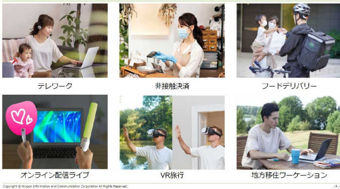
Copyright © Nippon Information and Communication Corporation All Rights Reserved. - 8 -