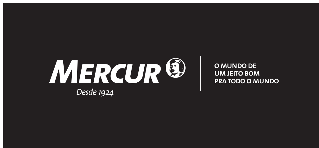
VERSÃO PRINCIPAL - BRANCO SOBRE PRETO

A marca deve ser preservada e apresentada sempre em conformidade com o padrão e as normas deste manual.