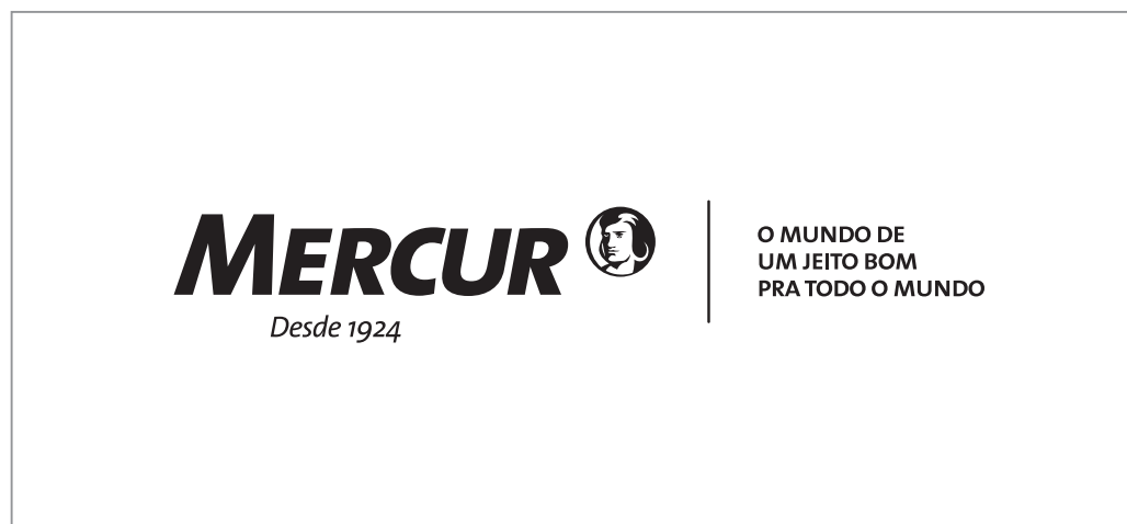
VERSÃO ALTERNATIVA - PRETO SOBRE BRANCO

A marca deve ser preservada e apresentada sempre em conformidade com o padrão e as normas deste manual.