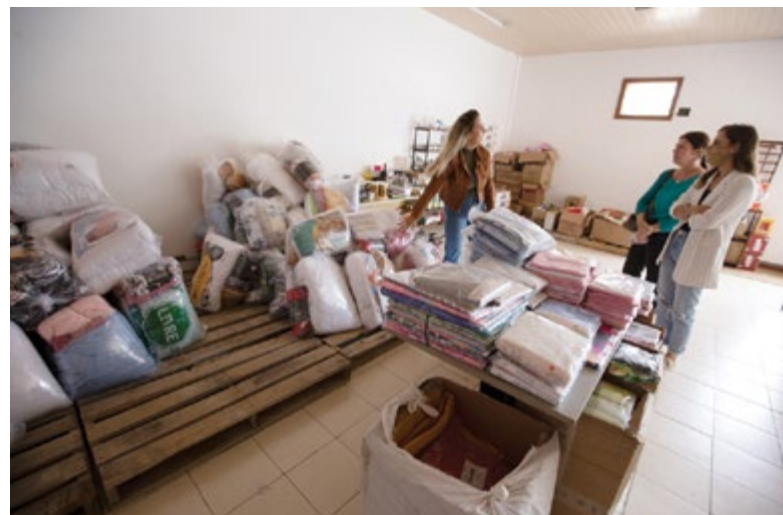
Toalhas, roupa de cama, chinelos e roupa íntima foram doados às famílias

Todas as contribuições foram feitas com recursos doados pelos associados. “A ajuda que os associados prestaram em Petrópolis foi preciosa. Por meio de uma parceria inédita entre Amperj, MPRJ e Assemperj foi possível desabrigar 28 famílias, bem como entregar centenas