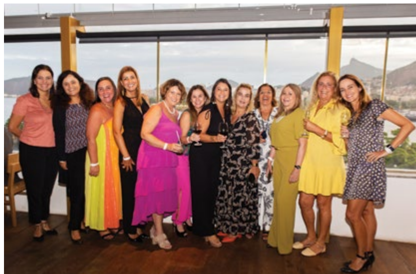
Celebração pelo Dia Internacional da Mulher da Amperj reuniu quase 100 associadas