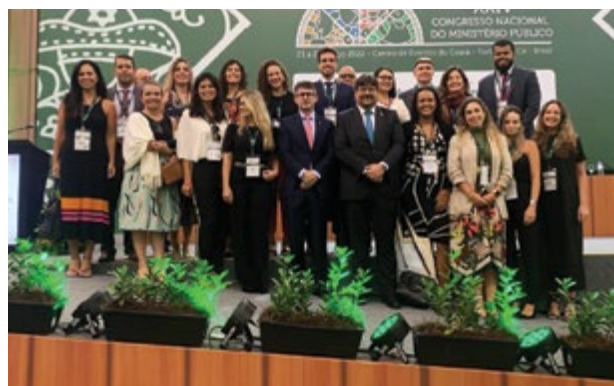
Delegação do Rio no 24º Congresso contou com 45 pessoas

O 24º Congresso Nacional do Ministério Público, realizado em Fortaleza, de 23 a 25 de março, teve 45 membros do MPRJ entre os inscritos, dentre os quais o presidente da Amperj, Cláudio Henrique Viana, e o procurador-geral de Justiça, Luciano Mattos. Nos três dias do evento foram apresentadas teses e diversos temas foram discutidos em painéis e palestras. A forte presença do público feminino foi destaque no evento.