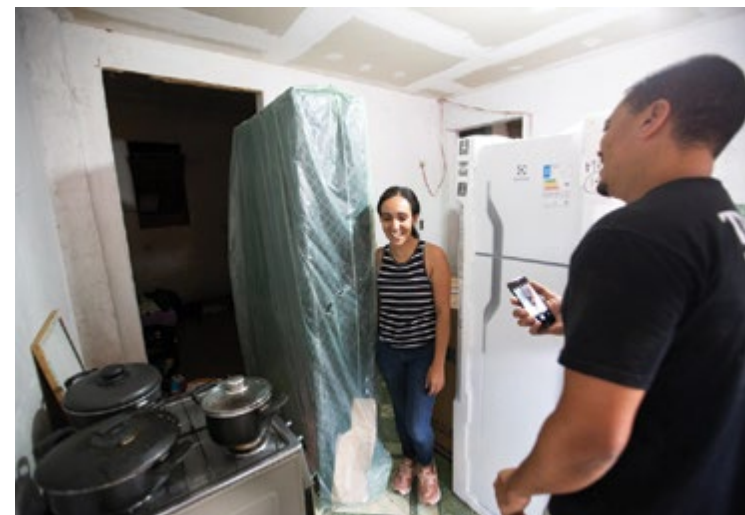
Recursos também foram usados para a compra de camas e eletrodomésticos

As doações foram pensadas para suprir essas demandas. Denise conta que “a campanha foi de suma importância para garantir o