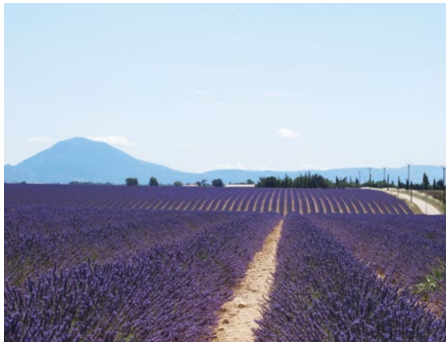
Campo de lavanda em Valensole e a simpática aldeia de Lourmarin