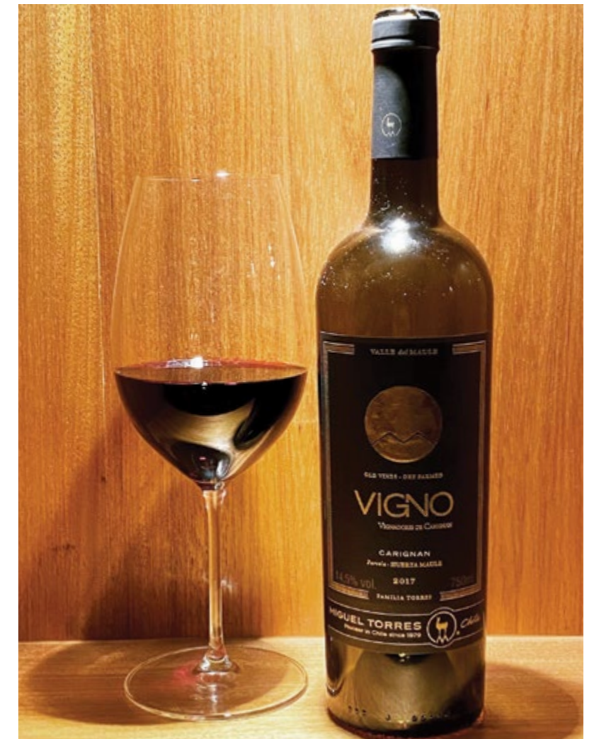
Marca Vigno no rótulo garante vinhos com pelo menos 85% de Carignan

Porém, alguns dos vinhos mais interessantes elaborados com a Carignan vêm do Valle del Maule, no Sul do Chile. Não há dados históricos precisos, mas imagina-se que a