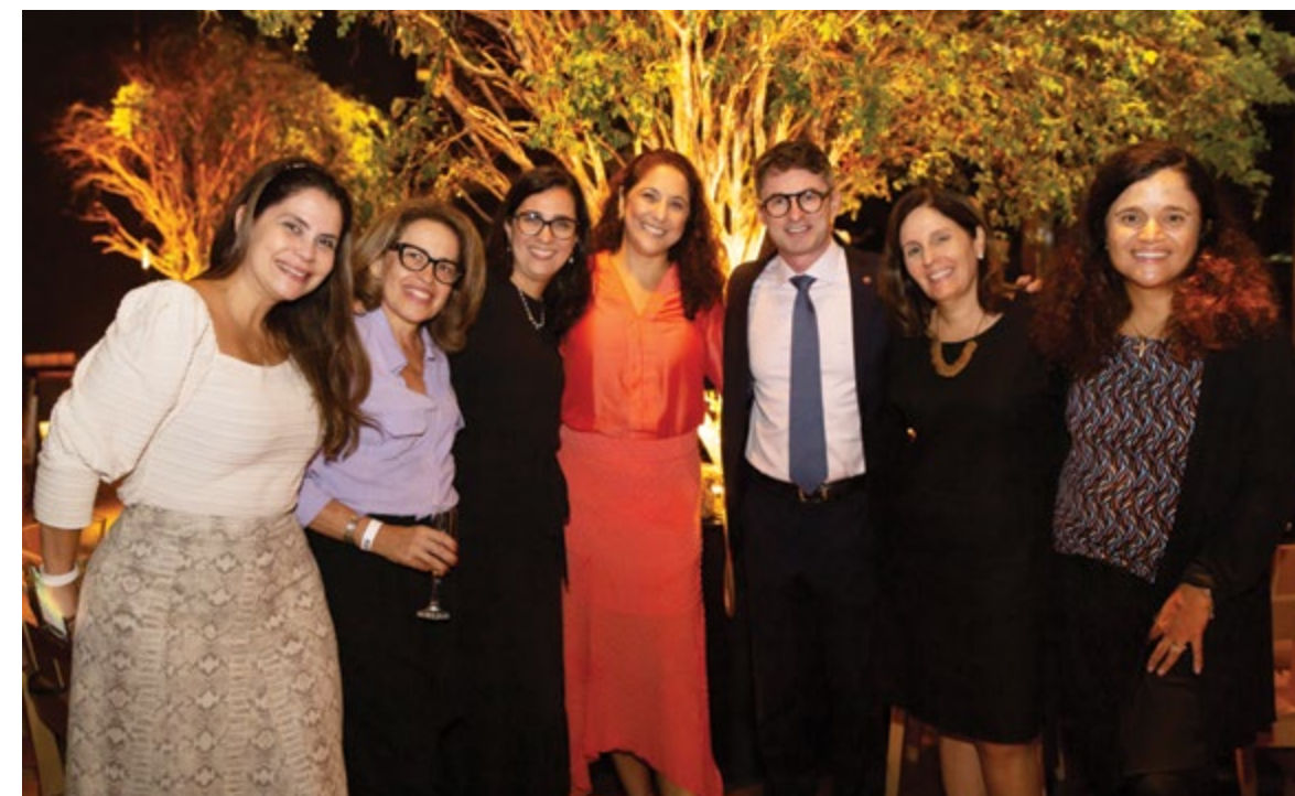
O MP do Rio é um dos três com mais mulheres no Brasil

É um investimento que valoriza o seu imóvel, reduz seus custos e trará grandes retornos! Consulte seu gerente.