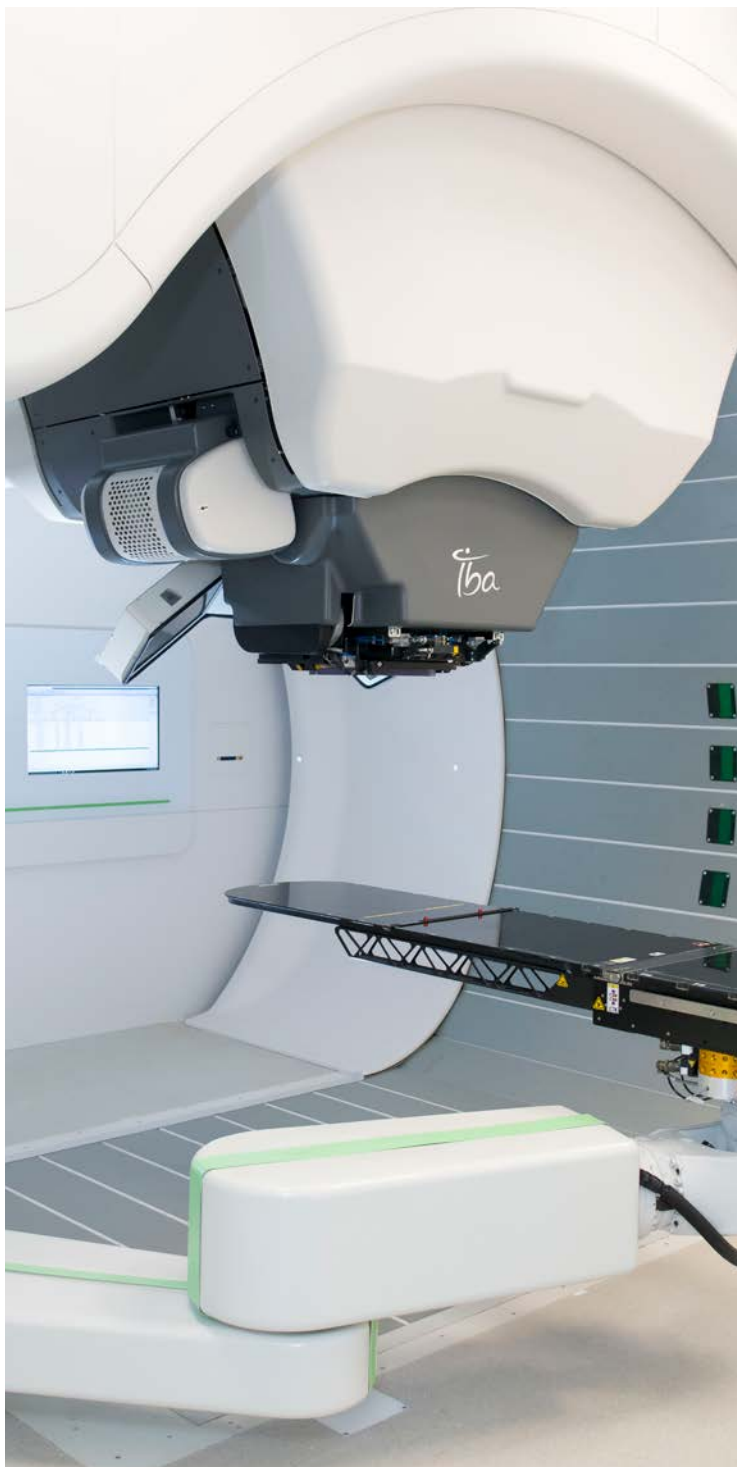
جناح المعالجة بإشعاع البروتون