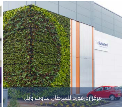
مركز رذرفورد للسرطان ساوث ويلز