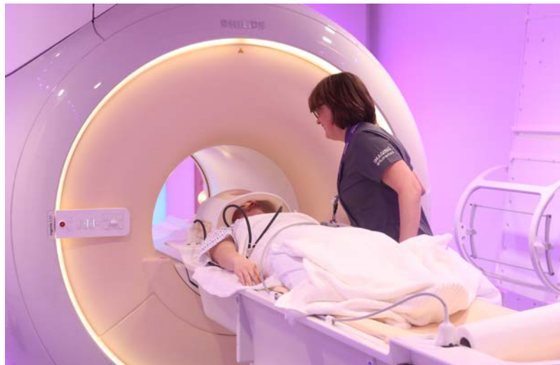
التصوير بالرنين المغناطيسي والتصوير المقطعي المحوسب