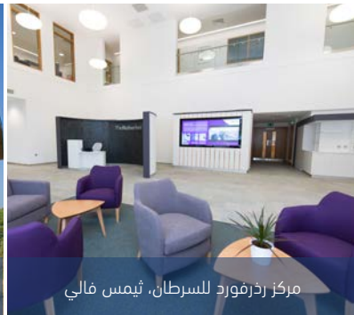
مركز رذرفورد للسرطان، ثيمس فالي