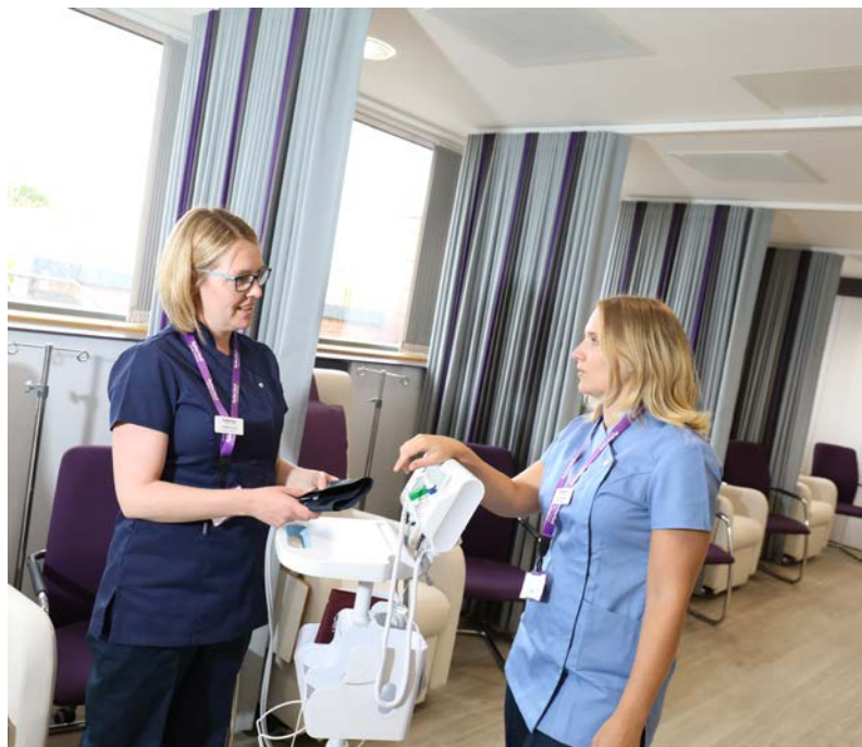
المعالجة الكيماوية/ المعالجة المناعية