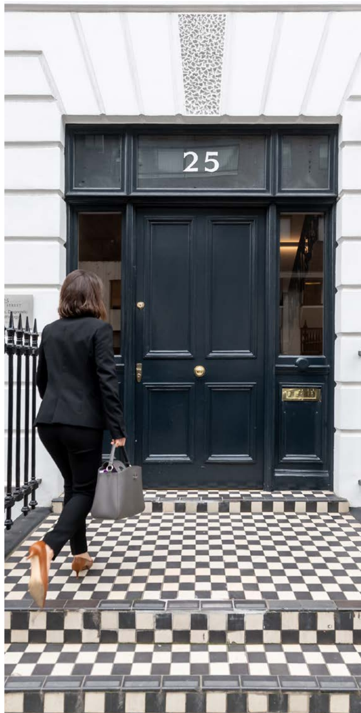
25 Harley Street