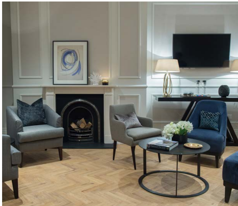
سكن للمرضى على نمط الفنادق