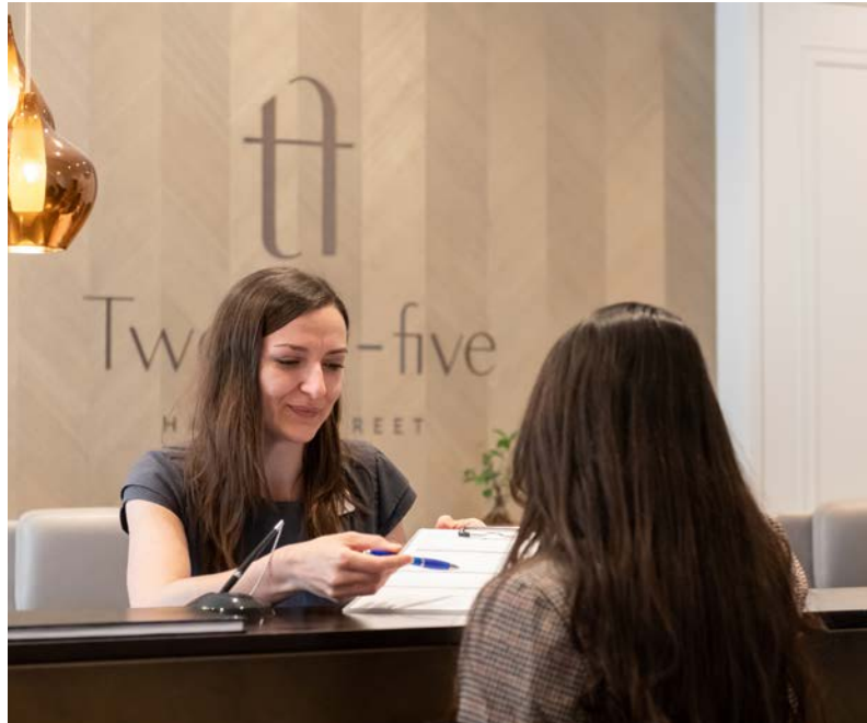
فريق هارلي ستريت