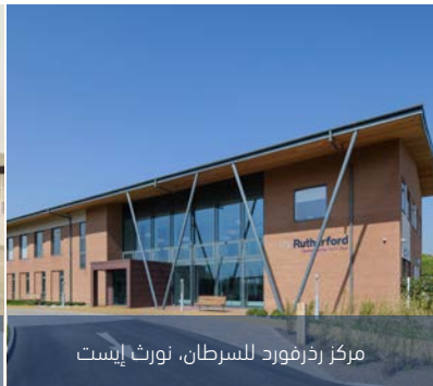
مركز رذرفورد للسرطان، نورث إيست