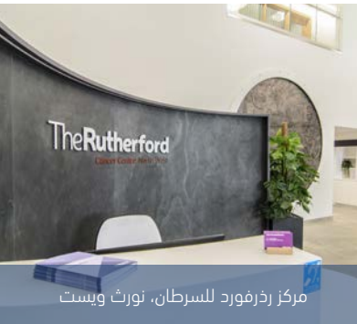
مركز رذرفورد للسرطان، نورث ويست