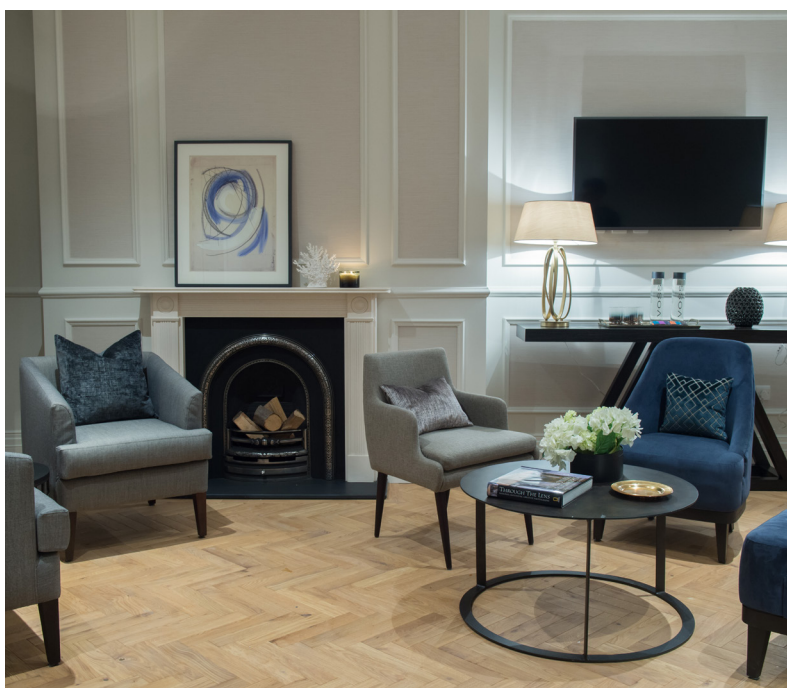
五星级酒店式就医环境