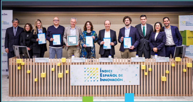
ÍEI 2024, grupo de premiados