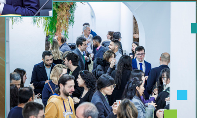
ÍEI 2024, coffee break