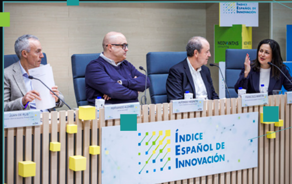
ÍEI 2024, panel de empresas ganadoras: Balay, Ikea y Oiuigo