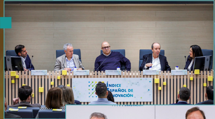
Premios a la Innovación 2024 ÍIS Global: Toyota ÍIS Español: Balay ÍID Español: Cabify