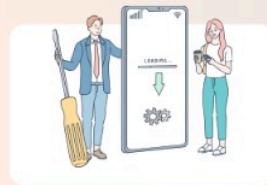
Pembahasan Bisa di Download dan diPrint