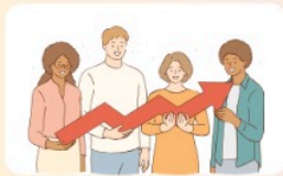
Simulasi Seperti Tes Aslinya (Materi, Jumlah Soal, dan Waktu Tes nya)