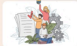
Latsol Harian, Materi, Bimbingan dari 0 Sampai Terlatih, Grup Diskusi Premium