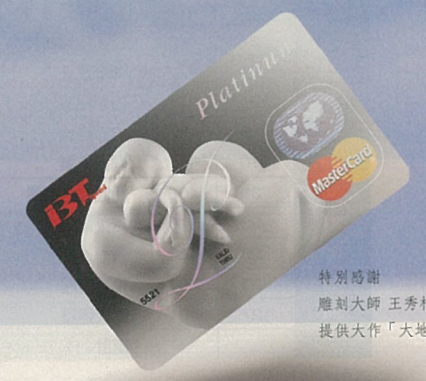
特別鳴謝 雕刻大師 王秀杞先生 提供大作「大地之母」

92.3.15~92.12.31（東京航線：92.3.15~92.6.30止），持台北商銀白金卡刷卡購買長榮航空國際航線商務艙來回機票，最低可享四折優惠。