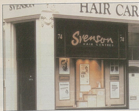
英國史雲遜髮理學中心

台灣人對掉髮的態度 全球經濟的普遍不景氣，使得現代人的壓力愈來愈大，根據調查指出，78%的國人有掉髮困擾，而且大部份的人因為缺乏正確的諮詢管道，往往在不清楚自己真正的掉髮原因下，試著用擦偏方和生髮水解決掉