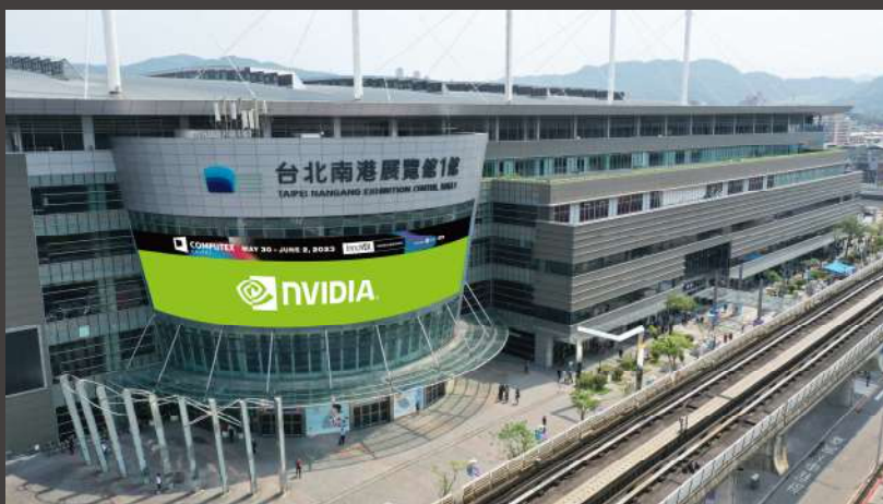
南港展覽館1館 (TaiNEX 1)