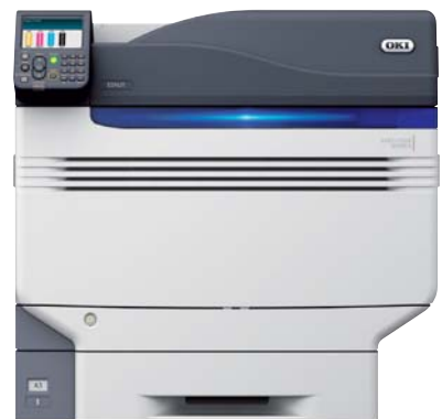
本型錄是由OKI C941dn實機印製