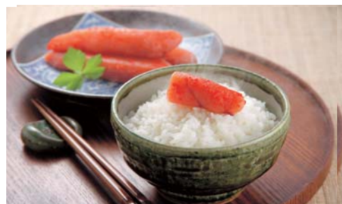
餐廳季節菜單列印