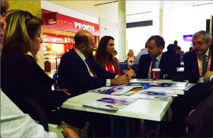
Encontro para inserção do Brasil na candidatura mundial de feridas 2020.