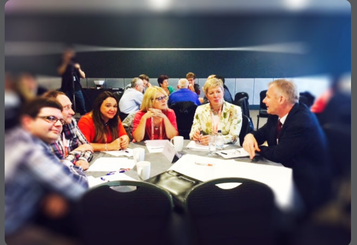
Participação da SOBENFeE na reunião do Conselho de Sociedades Colaboradoras Nacionais e Internacionais da EWMA.