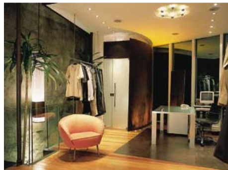
Área de atendimento: primeiro mezanino