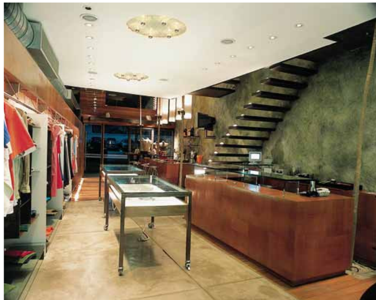
Vista em direção à rua: pequeno espaço acomoda funções variadas; luminotécnica pode alterar clima

Ficha Técnica Einstein Jeans Local São Paulo-SP Projeto 2000 Conclusão da obra 2001 Terreno 82 m 2 Área construída 200 m 2 Arquitetura e interiores Vicente Giffoni Paisagismo Ricardo Pinto Luminotécnica Peter Gasper Estrutura e fundações Projest: Gilberto Valle Elétrica Instalações Cedro Projetos Ar condicionado Datum Construção Lock