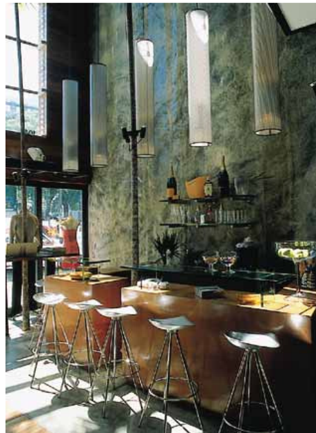
O bar, localizado na entrada da loja, estimula a entrada e a permanência

Texto resumido a partir de reportagem de Adilson Melendez Publicada originalmente em PROJETODESIGN Edição 266 Abril 2002