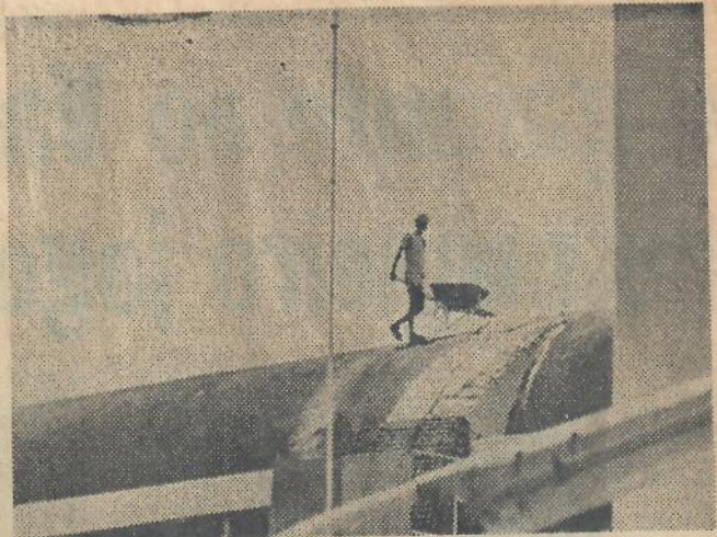
Já sem balizas, o gramado começa a ser todo refeito