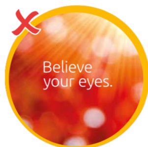
Area Arte na Tampa

→ Curvatura é a conversão de um rótulo retangular em um rótulo cônico. O Impressor ira executar esta curvatura com prazer para você.