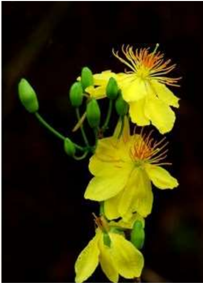
Hoa Mai

Tết – theo cách hiểu của các nhà thâm Nho – là biến thể của chữ Tiết 11 . Trong nhiều dịp “ăn tết” suốt một năm của người Việt, ăn Tết Nguyên Đán là lớn nhất, nên khi nói đến Tết, ai cũng nghĩ đến ngày này. Tết phản ánh trung thực nền nông nghiệp nhiệt đới nên thường trùng vào các ngày cuối tháng một và đầu tháng hai dương lịch. Tết bắt đầu từ ngày một tháng giêng (tức tháng chính). Tuy sự chuẩn bị khá công phu và tầm quan trọng hàng đầu so với các ngày tết khác, Tết Nguyên Đán mang nặng tính chất gia đình, chan chứa tình cảm của người Việt Nam.