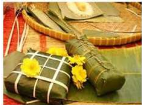
Bánh chưng, trái; Bưởi tết, phật

Tết chú trọng đến ơn nghĩa nên đủ loại quà lớn nhỏ được chuẩn bị chu đáo như những gói quà Giáng Sinh mang nặng tình cảm và lòng biết ơn nhau giữa những người thân, bạn bè, đồng nghiệp và cả những người đang phải làm việc xa nhà. Tuỳ theo khả năng tài chánh của mỗi gia đình mà nội dung món quà được gói ghém thích hợp. Những hộp bánh mứt do chủ nhà tự tay làm lấy hay mua ngoài tiệm biểu lộ sự chu đáo và tình cảm của người cho và người nhận.