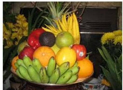
Mâm Ngũ Quả Ngày Tết

Ngày Tết phải dùng đến nhiều tiền bạc hơn ngày thường. Nào là quần áo mới cho con và cho ông bà. Lễ