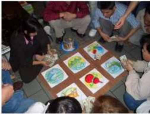
Một bàn đầu cua cá cốp

Thế rồi mọi sự lo toan, sắm sửa, chuẩn bị sẽ phải kết thúc vào chiều ba mươi Tết. Đường phố thưa dần người qua lại. Họ hối hả về nhà để kịp cúng tất niên và rước ông bà. Lễ rước ông bà là một mâm cơm tươm tất với những món ăn mà người nội trợ trong nhà đã bỏ công ra làm từ mấy tuần trước, cùng các loại hoa quả, bánh mứt. Sau đó mọi người trong gia đình quây quần bên nhau để ăn tất niên. Do vậy, ai không thể về nhà vào chiều ba mươi Tết sẽ cảm thấy vô cùng cô đơn, bất hạnh. Ăn xong, trẻ con có quyền ướm thử quần áo mới, trong tay đã thấy vài bao lì xì đỏ đỏ. Người lớn thì gấp rút lo phẩm vật để cúng giao thừa.