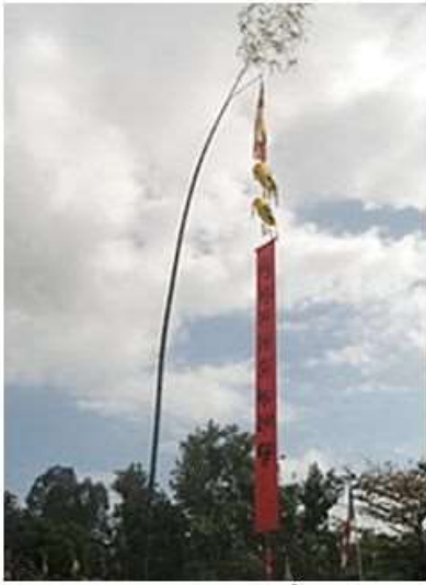
Cây Nêu Ngày Tết

Đối với người Việt Nam, Tết là sinh nhật cho tất cả. Bất kể sinh ra vào ngày tháng nào trong năm, đến ngày Tết là thêm một tuổi. Do vậy, người Việt thường hỏi nhau, “Năm nay anh (hay chị) mấy tuổi?” là có ý muốn hỏi “tuổi con gì.” Người Việt có 12 con giáp dùng cho ngày, tháng, năm: Tý (con chuột); Sửu (con trâu); Dần (con cọp); Mão hay Mẹo (con mèo); Thìn (con rồng); Tỵ (con rắn); Ngọ (con ngựa); Mùi (con dê), Thân (con khỉ), Dậu (con gà); Tuất (con chó); Hợi (con heo). Mỗi con vật tượng trưng cho bản chất và đặc tính của mỗi người.