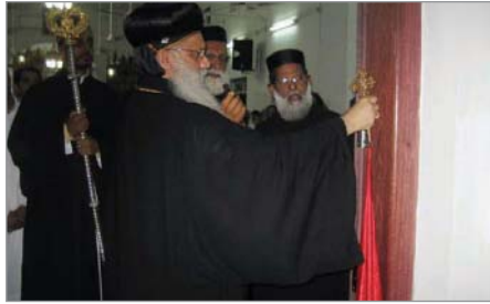
നവീകരിച്ച കത്തീഡ്രൽ: താൽക്കാലിക കുദാശ (16-4-11)