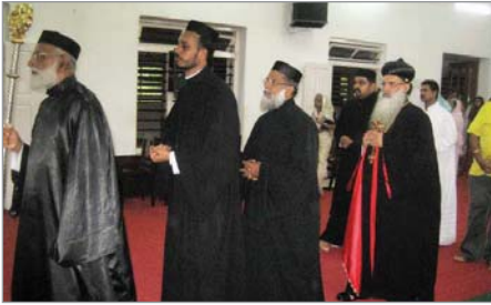
കത്തീഡ്രലിലേക്ക് സ്വീകരണം (16-4-11)