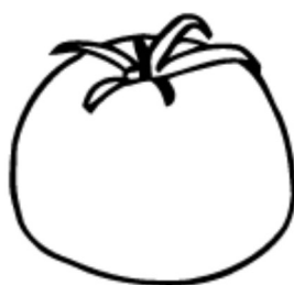
el tomate / tomato