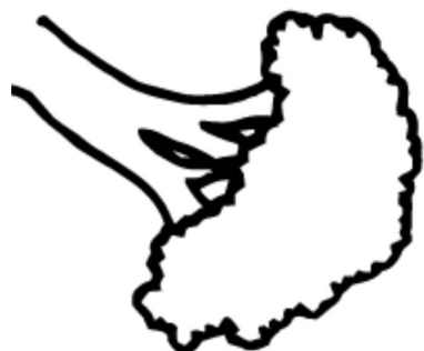
el brócoli / broccoli