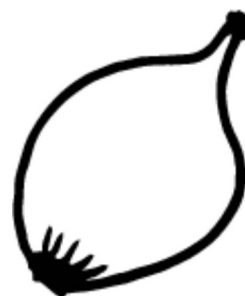
la cebolla / onion