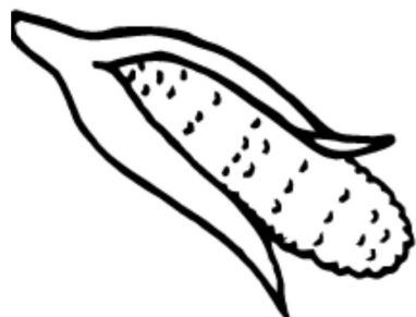
el maíz / corn