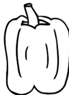
el pimiento / pepper