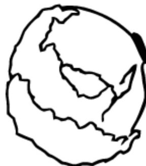
la lechuga / lettuce