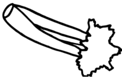
el apio / celery