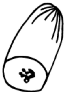
el pepino / cucumber