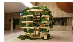
Το Growroom της SPACE10 και του Ikea Lab.

Η ιδέα αυτή, διακρίθηκε ως μία από τις πιο καινοτόμες ιδέες παγκοσμίως την τελευταία εβδομάδα του φετινού Φεβρουαρίου.