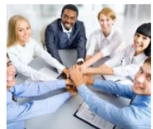
Η χώρα μας έχει εξαιρετικό ανθρώπινο δυναμικό, που μπορεί και πρέπει να το αξιοποιήσει.

Η χώρα μας είναι η πιο πλούσια σε φυσικούς πόρους, συνδυάζοντας μοναδικά πλεονεκτήματα