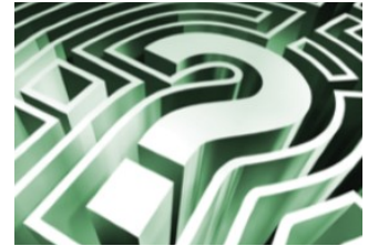
Η κατάσταση αβεβαιότητας συνεχίζεται για την Ελληνική Οικονομία.

Σε κάθε περίπτωση, η ανάγκη για εργασία και παραγωγικότητα σε αυτή τη χώρα είναι περισσότερο επιτακτική από ποτέ. Πρέπει επιτέλους να αρχίσουμε να παράγουμε έργο. Έργο, όχι λόγια.