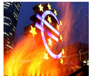
Το φαινόμενο του αποπληθωρισμού δεν είναι μόνο ελληνικό φαινόμενο.

Επικοινωνήστε μαζί μας στο 2310.214971 SPIRAL business solutions—www.spiral.com.gr