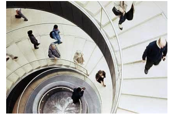
Από τη σπείρα του αποπληθωρισμού καλείται να εξέλθει άμεσα η χώρα μας.

Είναι χαρακτηριστικό, ότι σε σχετική μελέτη της Διεύθυνσης Οικονομικών Μελετών και Προβλέψεων της Eurobank, διαπιστώνεται ότι στην περίπτωση που "οι αποπληθωριστικές πιέσεις συνεχιστούν περισσότερο από το 2014" τότε "οι αρχές θα πρέπει να παρέμβουν άμεσα με ενεργές πολιτικές τόνωσης της οικονομίας με νομισματικά και δημοσιονομικά μέσα", καθώς και "με ευθεία ποσοτική επέκταση της προσφοράς χρήματος". Στο πλαίσιο αυτό άλλωστε, έρχεται και η απόφαση της Ευρωπαϊκής Επιτροπής για αναθέρμανση της οικονομίας με το λεγόμενο "Πακέτο Γιουνκέρ" (ή Ντράγκι), ύψους 315 δις ευρώ, ένα γεγονός από το οποίο η Ελλάδα θα πρέπει να αντλήσει τα μέγιστα και συναρτήσει του ήδη εγκριμένου ΕΣΠΑ 2014 - 2020, ύψους 19 δις ευρώ, να οδηγηθεί ξανά στις ατραπούς της ανάπτυξης και την έξοδο από τη σπείρα του αποπληθωρισμού.