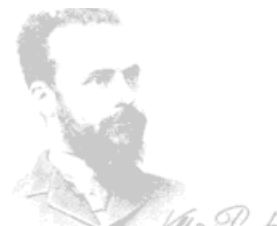
Ο Vilfredo Pareto παρατήρησε ότι το 20 των καρπών μπιζελιού στον κήπο του περιείχε το 80% των μπιζελιών

Ο Perry Marshall υποστηρίζει κάτι μοναδικά εκπληκτικό: ότι η Αρχή του Pareto είναι εκθετική!