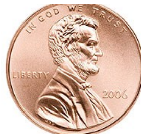
Ο Perry Marshall πουλά το βιβλίο του για 1 μόνο Σεντ!

Ο Perry Marshall υποστηρίζει κάτι μοναδικά εκπληκτικό: ότι η Αρχή του Pareto είναι εκθετική!