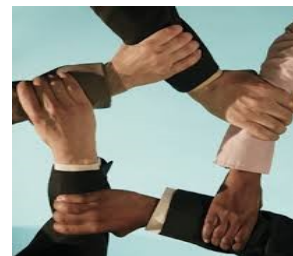
Η σημασία της ανθρώπινης συνέργιας στην καινοτομική επιχείρηση είναι καταλυτική

“Η υγιής επιχείρηση αποτελεί ένα σύστημα ‘αρνητικής εντροπίας’ που συνεχώς δημιουργεί νέα τάξη και νέες δομές, ώστε να επιβιώνει και να αναπτύσσεται”