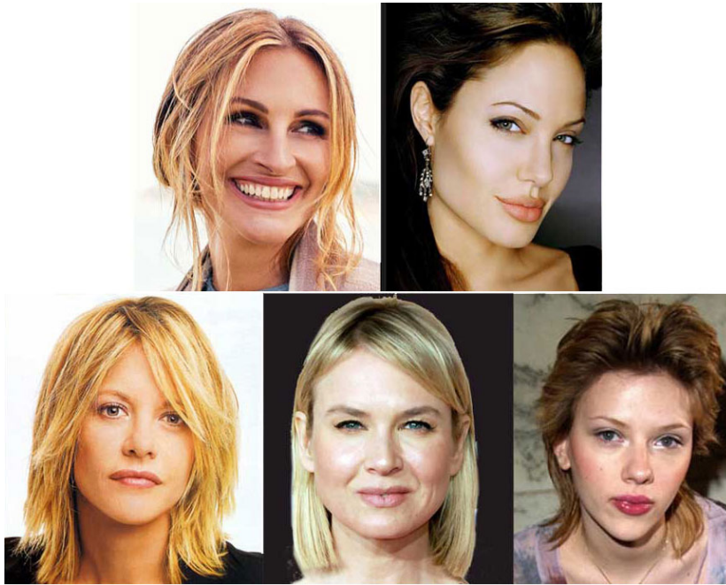
Д. Робертс, А. Джоли, М. Райан, Р. Зеллвегер, С. Йоханссон

желателен, но не обязателен, а вот рот должен быть необычной формы. Вот и всё. Только форма рта! Актриса может быть самой что ни на есть раскрасавицей и суперталантливой, но, если у неё рот, как у всех, её шансы стать звездой малы. Заметь, я сказал необычный рот, а не обязательно красивый. Маленький, огромный, кривой, пухлый, узкий, как щель в копилке — не важно. Главное, чтобы необычный. Именно рот цепляет мужской взгляд, как рыбку на крючок.