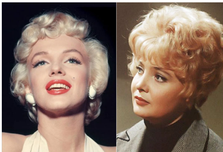
Мэрилин Монро и Татьяна Доронина