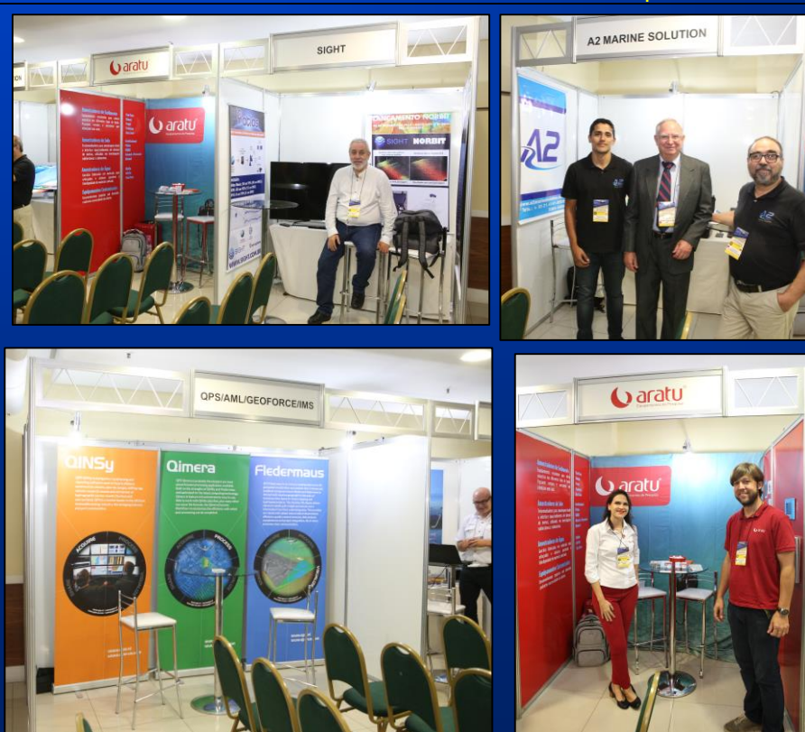
Show-room - I SBGGM/2018

Para as demais categorias e interessados, favor nos contatar para cotação.