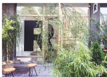
© Ravnikar Gallery Space je ena izmed četverice slovenskih galerij, ki se bodo predstavljale na Dunaju. Foto: Ravnikar Gallery Space/Facebook stran