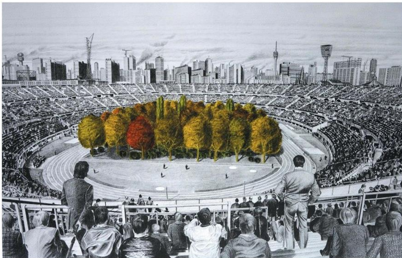
▲奥地利艺术家和建筑师马克斯·潘特纳的反乌托邦绘画艺术作品《自然不倦的魅力》铅笔素描。