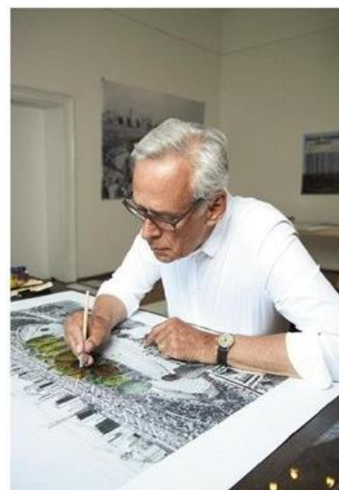
▲克劳斯·李特曼(Klaus Littmann)生于1951年,在当代艺术领域享有盛名,他的作品往往体现当代艺术和城市空间之间的冲突。