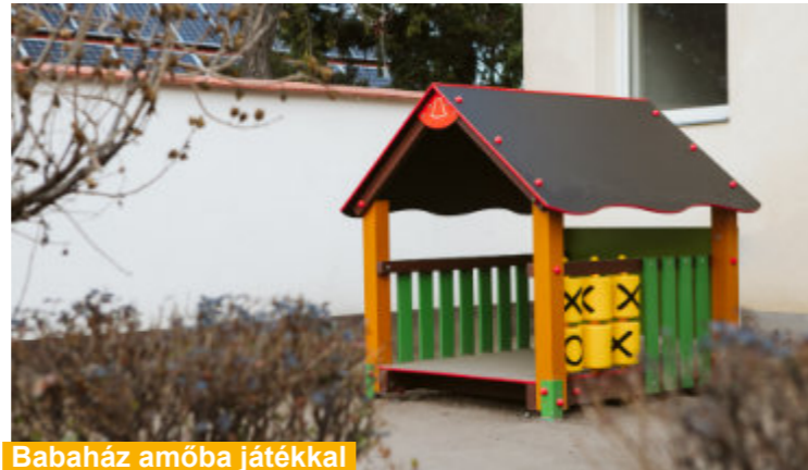
Babaház amőba játékkal

meltetési Osztály munkatársai. De látványos változáson ment át a Tartsay utcai játszótér is, ahol a régi játszóelem helyére vadonatúj, több pódiumos, kétsúszdás várrendszert helyeztek ki, míg az újtelepi „nagyjátson” új kötélpiramis, és a régi kedvencek – az új kapaszkodókkal ellátott hajó, és a megjavított, speciális festékekkel kezelt vár – állnak a gyerekek rendelkezésére.