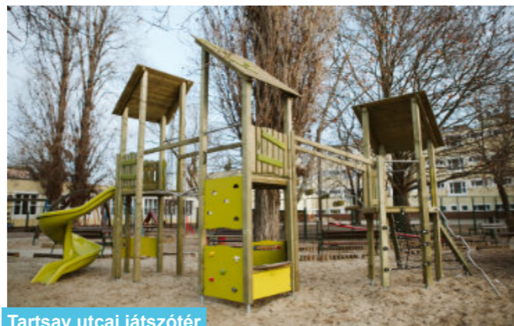
Tartsay utcai játszótér