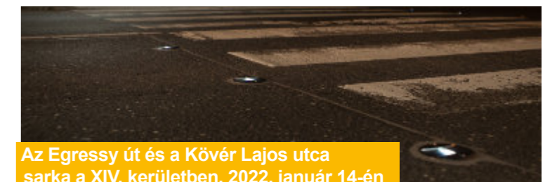
Az Egressy út és a Kövér Lajos utca sarka a XIV. kerületben, 2022. január 14-én