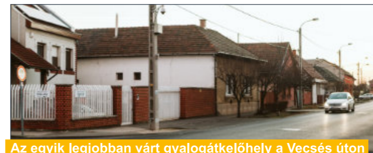
Az egyik legjobban várt gyalogosátkelőhely a Vecsés úton

Budapest teljes területén a Budapest Közút Zrt. a forgalomtechnikai létesítmények kezelője és üzemeltetője, ezért Önkormányzatunk már 2020. május 20-án helyszíni bejárással egybekötött szakmai egyeztetést tartott velük, amelynek alapján Soroksár hét, kritikus gyalogos közlekedési csomópontját jelölték ki új gyalogosátkelőhely létesítésére. Így került be a tervekbe Újtelepen a Köves út Mesgye utcai buszmegállója, a Csillag utcai tagóvoda előtti útszakasz, a Tárcsás-Könyves-Zománc utca vasúttal nehezített kereszteződése, a Vecsés úton három útkereszteződés, valamint a Majori út azon része, ahol játszótér működik. A tavaly júniusi nyílt közbeszerzési eljárás után augusztusban olyan tervezési