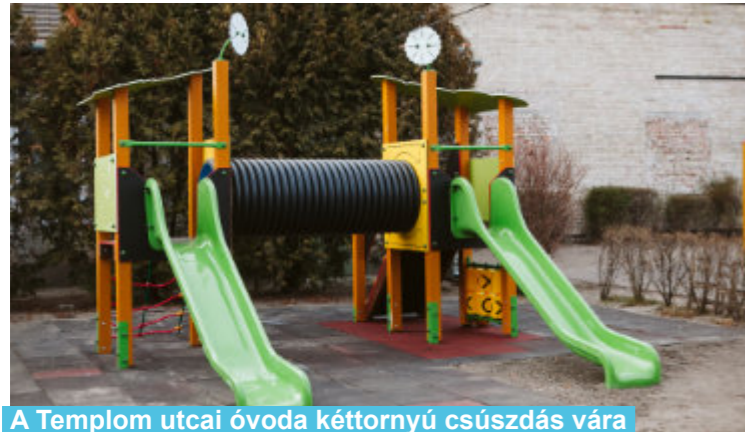
A Templom utcai óvoda kéttornyú csúszdás vára

Biztonságos játszóparkok várják a gyerekeket