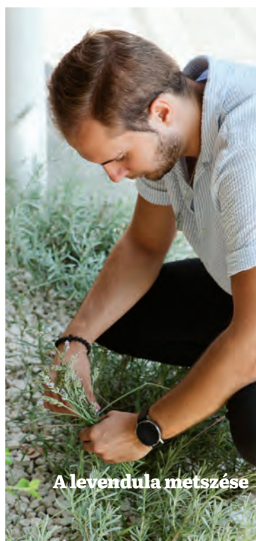
A levendula metszése

Az öntözés a mögöttünk álló hónapokban létfontosságúvá vált a 40 fokos hőmérsékleti csúcsokkal tarkított nyárban. Most itt az esély, hogy kertünk ékességeit kicsit formába hozzuk. Talán az előttünk álló időszakban már nagyobb mennyiségű csapadékra is számíthatunk, de az öntözést nem szabad elhagyni! A kissé megsárgult gyepek, a kókadózó levelű cserjék és fák kondíciója még javítható, ha a kevésbé meleg „vénasszonyok nyara” során továbbra is olyan elánnal öntözzük őket, mint a forróság idején! Ha naponta egyszer öntözünk, azt javasolt a reggeli órákban tenni, így biztosítjuk a megfelelő vízellátottságot és némi párat a növényeink számára, mellyel átvészselhetik a tűző napsütést, és a gombásodástól sem kell tartanunk.