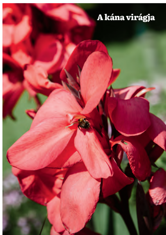
A kána virágja