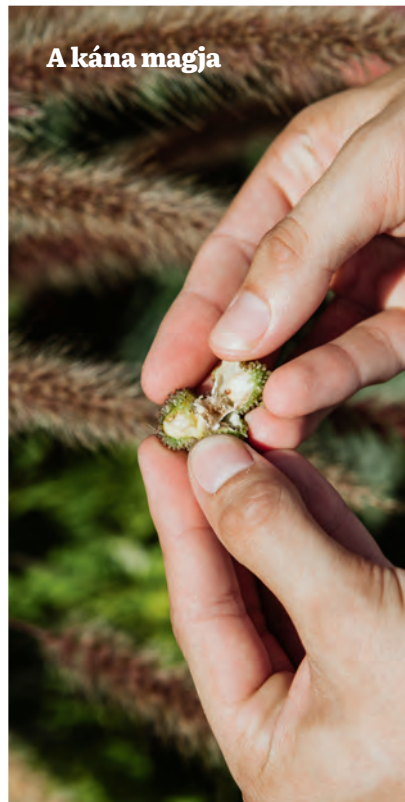
A kána magja