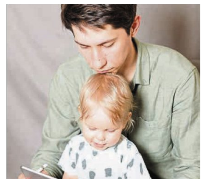
Ihre Elternzeit können Arbeitnehmer nur mit Zustimmung des Arbeitgebers verkürzen.