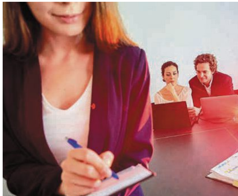
Ellenbogen ausfahren oder auf Kooperation setzen? Unternehmen schätzen Mitarbeiter, die grundsätzlich auch auf die anderen gucken.