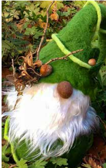
Wichtel mittel- FE0001 160