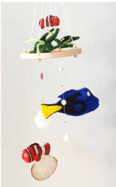
Mobile Variante 3 - FE0001 165