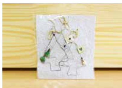
Drahtanhänger - FE0001 125