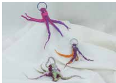
Schlüsselkrake - FE0001 169