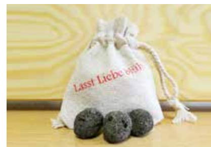
Samenbomben - FE0001 114