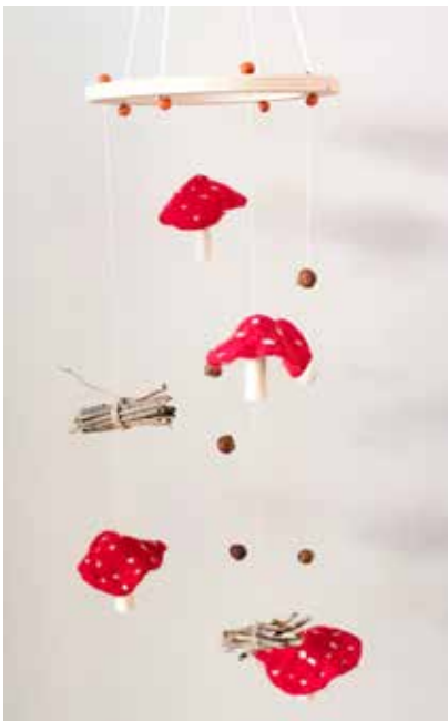
Mobile Variante 1- FE0001 163