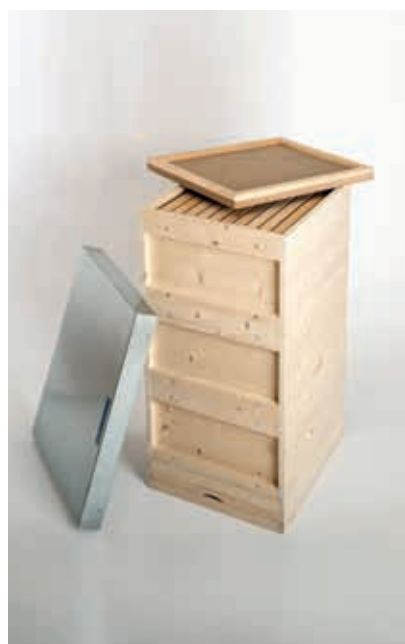
Metalldeckel und Komplettbeute Fichte