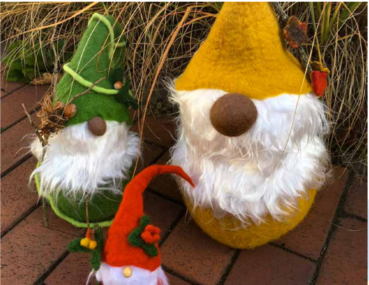
Wichtel Set - FE0001 162