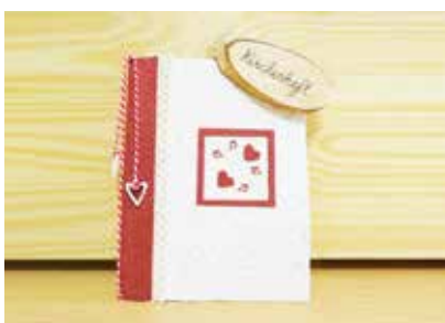
Kirchenheft mit Druck - FE0001 120