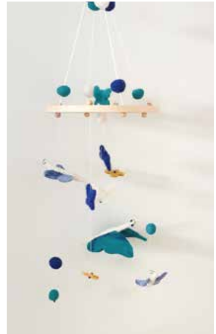
Mobile Variante 2- FE0001 164