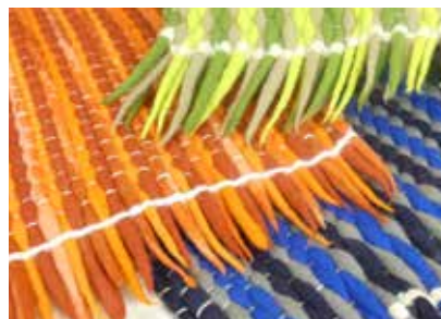
Sitzkissen aus Merinowolle - FE0001 167