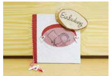
Einladungskarte mit Druck - FE0001 122