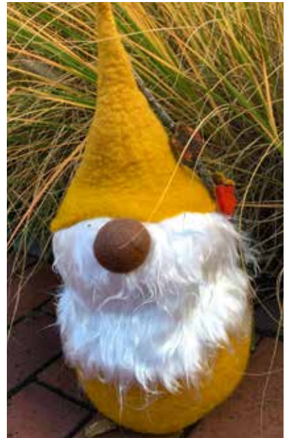
Wichtel groß- FE0001 161