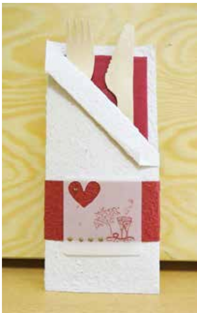
Bestecktasche - handgeschöpft - FE0000 833