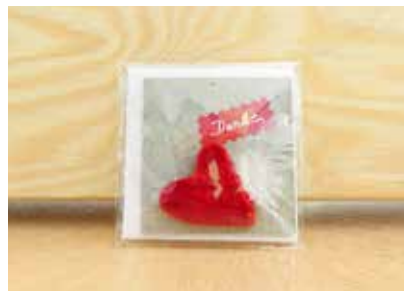
Grußkarte - FE0000 988