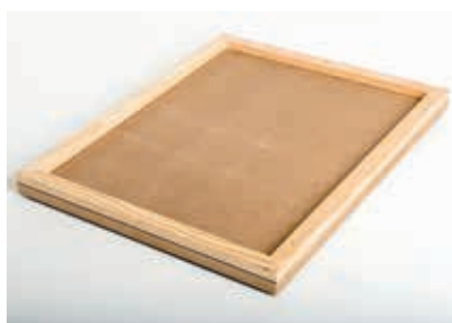
Deckel MDF Fichte