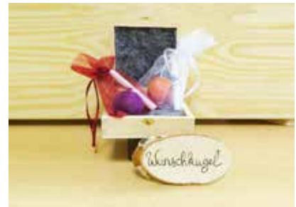
Wunschkuigel mit Stein - FE0001 116