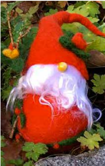
Wichtel klein- FE0001 159