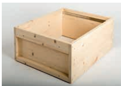
Zarge Zander Fichte