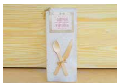
Menükarten mit Druck - FE0001 121