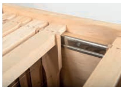
Zarge Zander Weymouthkiefer Detail