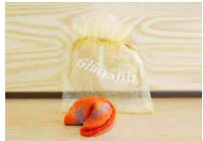
Glücksfilz - FE0001 112

Die Preise der Papier- und Filzprodukte finden Sie auf Seite 33.