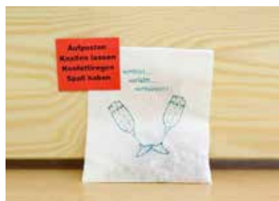
Knalltüte - FE0001 111