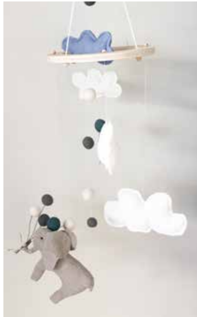
Mobile Variante 2- FE0001 164