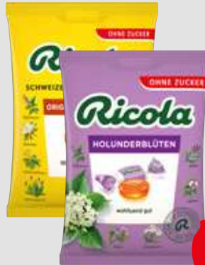
Ricola Bonbons ohne Zucker je 75g Beutel 1kg = 19,87