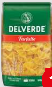
Delverde Buitoni aus 100% Hartweizen je 1kg Beutel