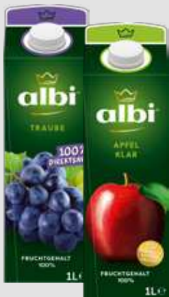
albi Fruchtsaft oder -nektar aus Konzentrat je 1l Packung