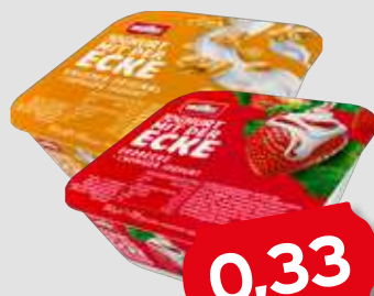
müller Joghurt mit der Ecke je 113-150g Becher 1kg = 2,92-2,20