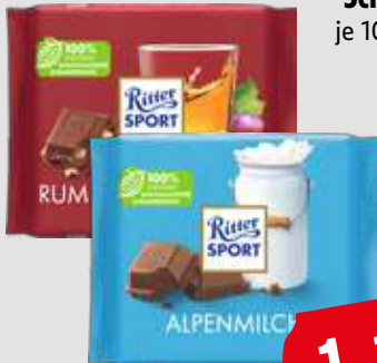
Ritter Sport Schokolade je 100g Tafel 1kg = 11,10