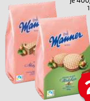
Manner Waffeln oder Snack je 400/300g Beutel 1kg = 6,23/8,30