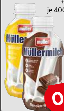
Müllermilch +0.25 Pfand je 400ml Flasche 1l = 1,98