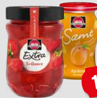
Schwartzau Brotaufstrich Samt oder Extra je 255-340g Glas 1kg = 7,80-8,85