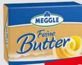
Meggle Butter 250g Packung 1kg = 9,16