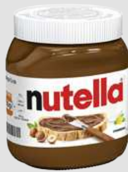
nutella Nuss-Nugat-Creme 450g Glas 1kg = 5,53