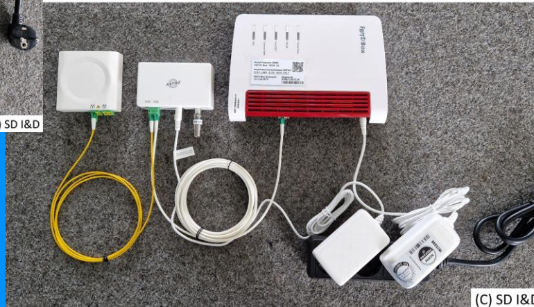
Passiv AP +FN + GF Fritzbox Basic (zukünftig bei linearem TV)