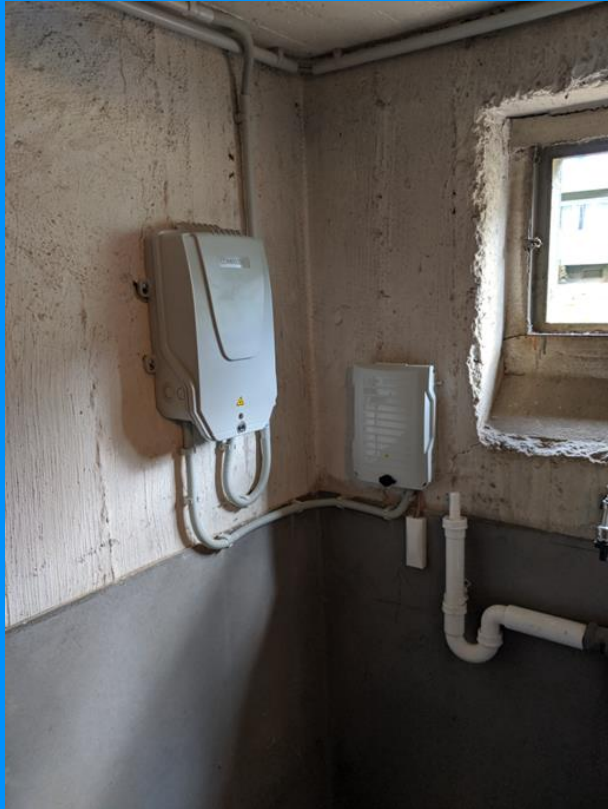
Glasfaserverteiler & Hausanschlusskasten (HAK)