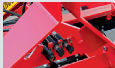
Schlauchgarderobe für Ordnung während der Lagerung