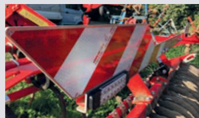
Warntafel mit LED-Beleuchtung