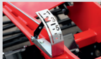
Gut sichtbare Skala der Tiefeneinstellung