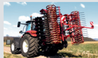
CROSSMAX 450 geklappt