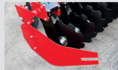
Randblech, manuell wegklappbar für Straßenfahrt