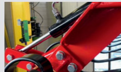
Vorwerkzeug hydraulisch wegklappbar