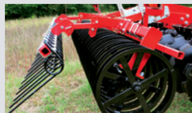
Striegel mit Höhenverstellung und Winkelverstellung