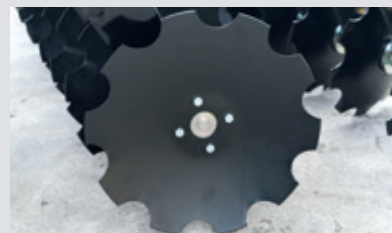
Gezackte Hohl­scheiben mit 510 mm oder 560 mm Durchmesser