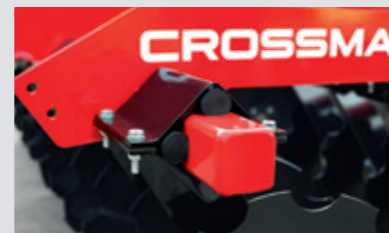
Jede Scheibe ist einzeln steingesichert