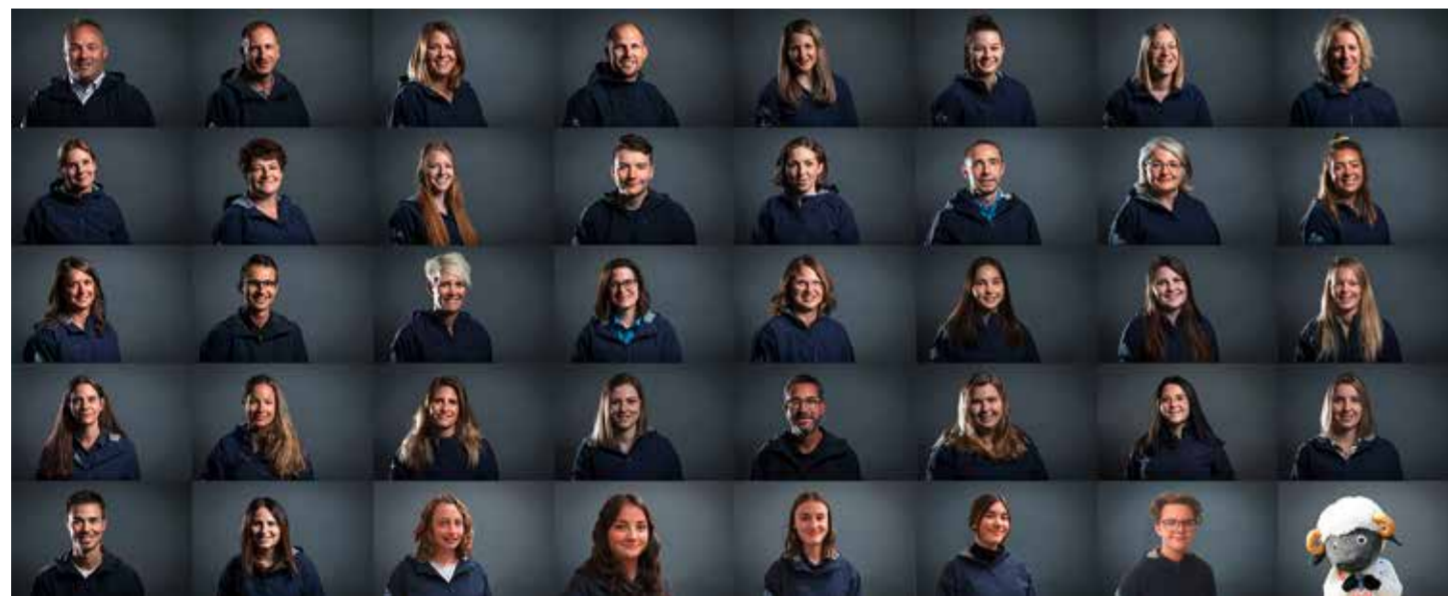
Team Zermatt Tourismus 2021

Zermatt Tourismus nimmt aber auch eine wichtige Funktion bei der Destinationsgestaltung ein. Gemeinsam mit den Delegierten wollen die Verantwortlichen die Zusammengehörigkeit und das Destinationsbewusstsein fördern. Auch intern will sich Zermatt Tourismus weiterentwickeln und den Mitgliedern als serviceorientierte Organisation gute Dienste erweisen. Dazu gehört sicherlich auch die Information über die Tätigkeiten, welche im Laufe des Jahres im «Zermatt Inside» oder auch laufend auf dem Extranet www.zt.net.ch publik gemacht werden. Zermatt Tourismus freut sich dabei über jede Rückmeldung und Vorschläge aus den Reihen der Mitglieder und Leistungspartner.