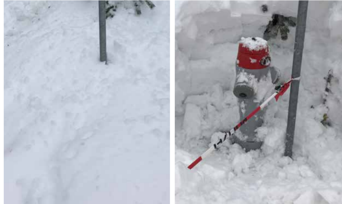
Gemeinderat und Feuerwehrkommando legen Wert darauf, dass die Löschwasserversorgung auch im Winter einwandfrei funktioniert. Wichtig ist in diesem Zusammenhang, dass sämtliche Hydranten zugänglich und von Schnee und Eis befreit sind.

Ihre Wasserversorgung und Feuerwehr Zermatt