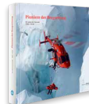
Buch zum 50-jährigen Jubiläum der Air Zermatt (1968–2018) Bestellungen an info@rottenedition.ch