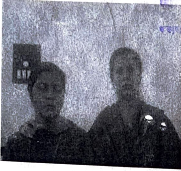
पट्टा देने वाला