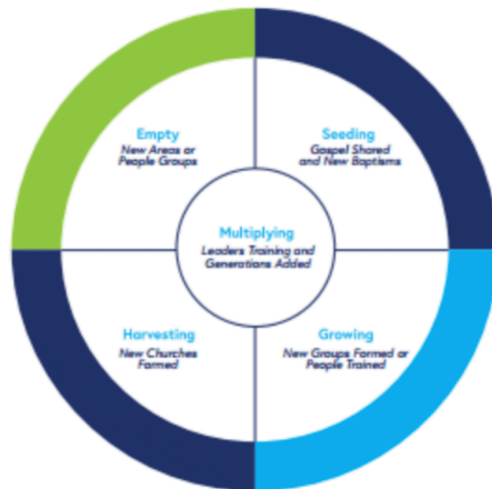
DIAGRAM DIAGNOSTIK EMPAT BIDANG