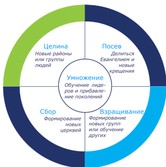
Диаграмма «Четыре поля»

Поле умножения: с кем, как и когда вы ищите верных людей, снаряжаете их для следования за Иисусом и призываете обучать других?